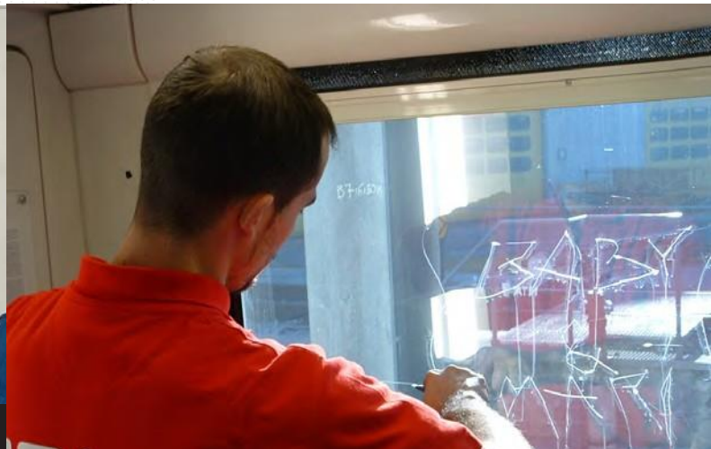
LÁMINA ANTIRRAYADO / ANTISCRATCHING

Una solución preventiva eficaz para luchar contra los riesgos de degradación, voluntario o no, de las superficies del entorno urbano